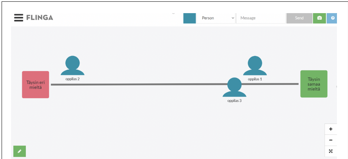
Esimerkki Flinga-alustalla tehdystä mielipidejanasta.

Luo Flingassa alustalle jana, jonka toisessa päässä lukee virtuaalisella lapulla "täysin eri mieltä" ja toisessa päässä "täysin samaa mieltä". Oppilaat pääsevät linkillä alustalle ja luovat hahmon, jossa on heidän oma nimensä (kts. esimerkkipuola alla). Opettaja sanoo aina yhden väitteen kerrallaan ja oppilaat siirtävät oman hahmonsaa mielipidejanalla haluamaansa kohtaan.